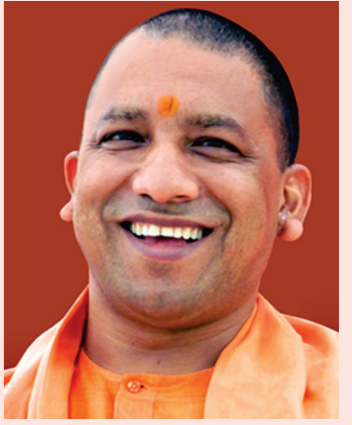
योगी आदित्यनाथ मुख्यमंत्री, उत्तर प्रदेश