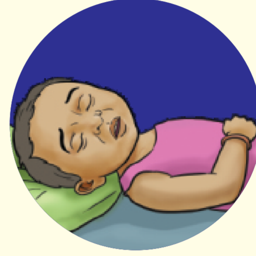
सुस्ती किंवा हालचाल न करणे