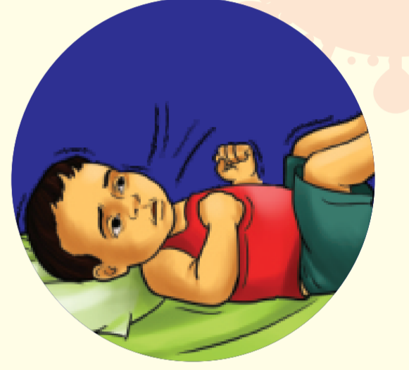
कधी कधी आकडी येणे

धोक्याची लक्षणे आढळल्यास त्वरीत जवळच्या म. न. पा. आरोग्य केंद्राशी संपर्क साधा