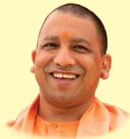
श्री योगी आदित्यनाथ माननीय मुख्यमंत्री, उत्तर प्रदेश