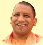
श्री योगी आदित्यनाथ माननीय मुख्यमंत्री, उत्तर प्रदेश