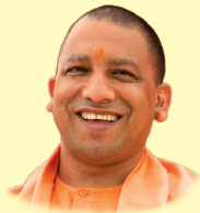
श्री योगी आदित्यनाथ माननीय मुख्यमंत्री, उत्तर प्रदेश