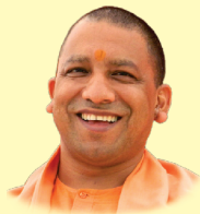
श्री योगी आदित्यनाथ माननीय मुख्यमंत्री, उत्तर प्रदेश