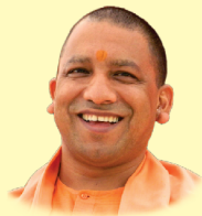
श्री योगी आदित्यनाथ माननीय मुख्यमंत्री, उत्तर प्रदेश