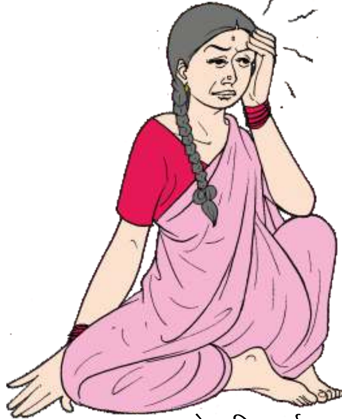
तेज सिर दर्द

ऐसी स्थिति में बिना समय गंवाए गर्भवती स्त्री को तुरंत डॉक्टर के पास या अस्पताल ले जायें