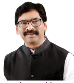
हेमंत सोरेन मुख्यमंत्री, झारखण्ड