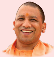
श्री योगी आदित्यनाथ माननीय मुख्यमंत्री, उत्तर प्रदेश