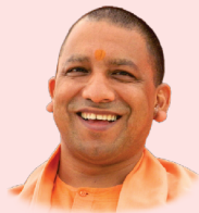
श्री योगी आदित्यनाथ माननीय मुख्यमंत्री, उत्तर प्रदेश