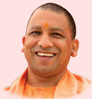
श्री योगी आदित्यनाथ माननीय मुख्यमंत्री, उत्तर प्रदेश