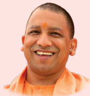
श्री योगी आदित्यनाथ माननीय मुख्यमंत्री, उत्तर प्रदेश