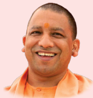
श्री योगी आदित्यनाथ माननीय मुख्यमंत्री, उत्तर प्रदेश