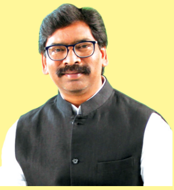
हेमंत सोरेन मुख्यमंत्री, झारखण्ड

हम सब ने मिलकर यह ठाना है, मिजल्स रूबैला से झारखण्ड को बचाना है