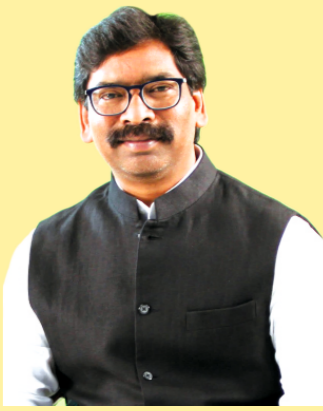
हेमंत सोरेन मुख्यमंत्री, झारखण्ड

जोतो ओडाक रेन गिदरा टीकाको जाम मा जाहाय गिदरा गे आलोको द्हुटाक ताबोन मा